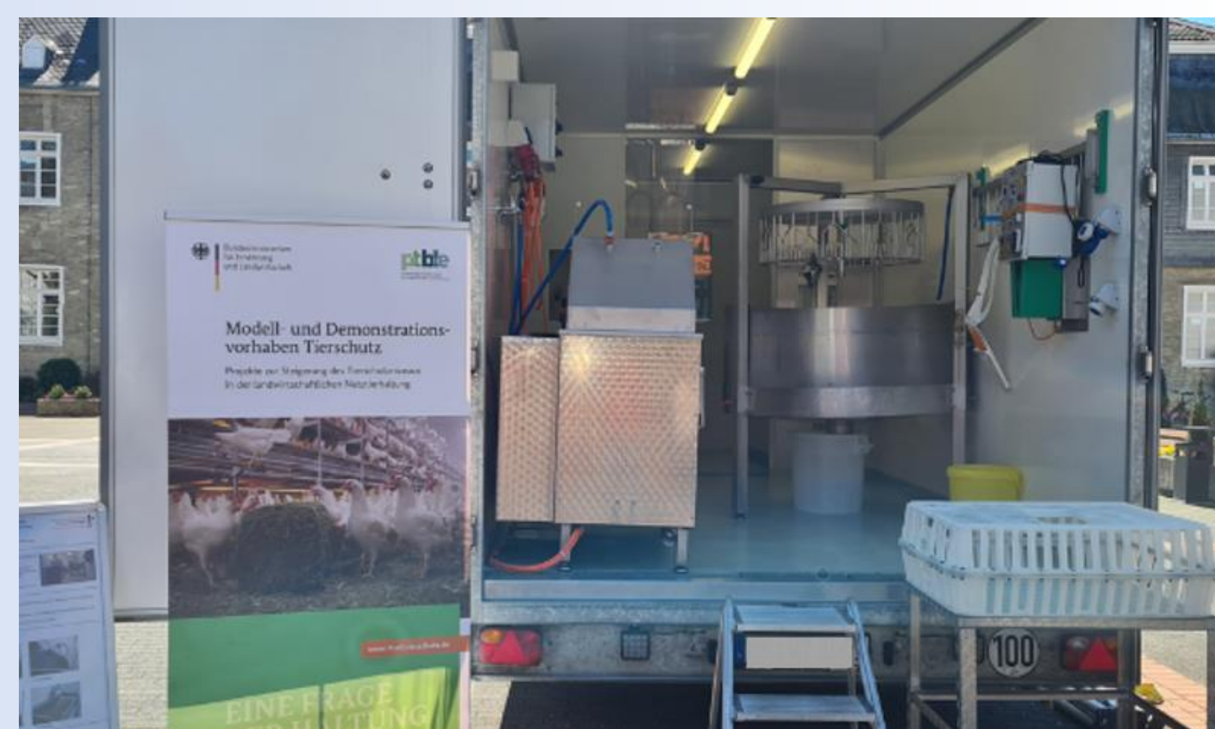
Vorstellung des Projektes auf dem Bio-Geflügeltag NRW auf Haus Düsse (Quelle: FH SWF).