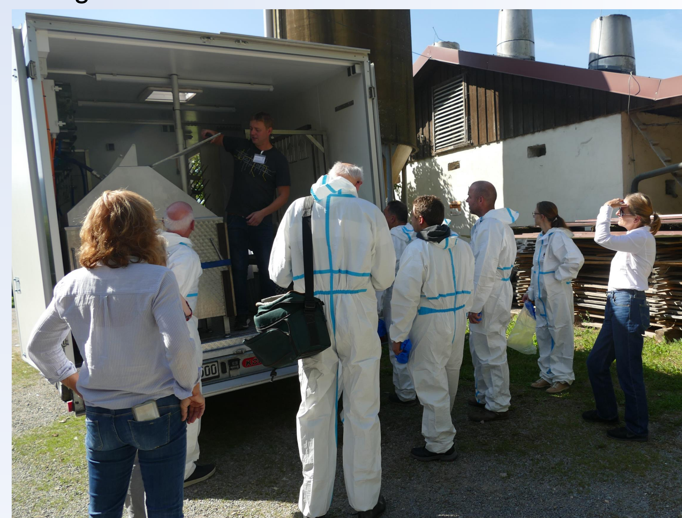
Besichtigung eines Schlachtmobils während eines Praxistages (Quelle: FH SWF).

Kontakt: mobilegefluegelschlachtung@fh-swf.de