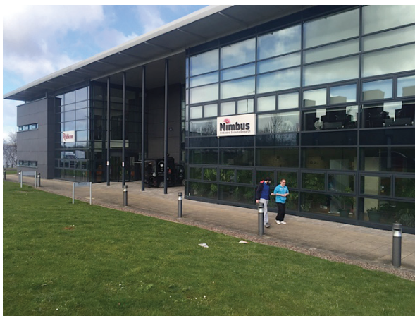
Rubicon Center am CIT

unterhält mit dem CIT eine Erasmus-Kooperation. Das Rubicon Center am Campus in Cork ist einer der führenden Business Inkubatoren in Irland und beherbergt mehr als 50 wissensbasierte Start-ups. Einem ersten Besuch in 2015 sollen weitere folgen. Für die Zukunft sind konkrete Kooperationsprojekte zwischen SWICE und dem Rubicon Center das Ziel.