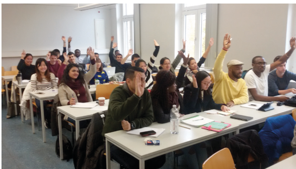
Entscheidungen wurden demokratisch getroffen

Im Wintersemester 2015 wurde dies im Rahmen der Lehrveranstaltung „Current Developments in Business II“ erstmals in Kooperation mit einem anderen Kurs erprobt. Gemeinsam mit dem Kurs „E-Business“ wurde ein Online-Shop für Merchandise-Artikel entwickelt. Dabei übernahmen die Studierenden des Kurses „E-Business“ die technische Umsetzung.