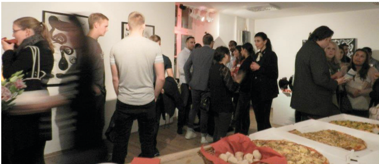
Impressionen von der ersten e-lounge