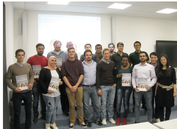
Teilnehmer des SWICE Business Idea Workshops

Vier Teams entwickelten in einem kreativen Prozess eigene Geschäftskonzepte. Dabei kamen die unterschiedlichsten Ergebnisse heraus: Vom Virtual Reality Center bis hin zu einer Plattform für Erfinder, die innovative Produkte vermarkten wollen. Sieger war das Team „Helpu“, mit der Idee für eine App, die Flüchtlinge mit Menschen die Hilfe leisten wollen in Verbindung bringt.