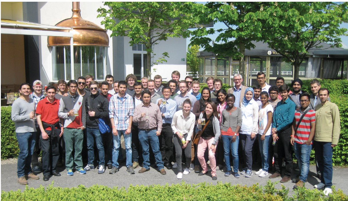
Teilnehmer der Exkursion zur Warsteiner Brauerei

ßender Diskussion im Weiterbildungszentrum von Warsteiner folgte eine Besichtigung des Betriebsgeländes. Natürlich durfte am Ende auch das Erzeugnis probiert werden. Ca. 50 Studierende des Studiengangs "Systems Engineering and Engineering Management" nahmen teil