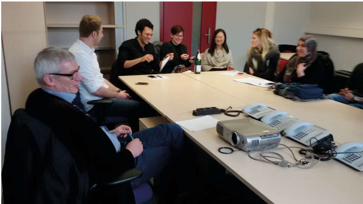
Erstes Meeting im SWICE-Lab

erstes Zuhause finden, Meetings abhalten können und sich gegenseitig inspirieren. Das SWICE-Lab bietet dabei eine Mischung aus notwendiger Infrastruktur und gemütlichem Ambiente. Das Labor soll das Zentrum für innovative Ideen auf dem Campus und ein Treffpunkt für Innovatoren und Trendsetter sein.