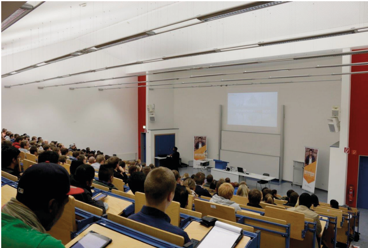
Bis zu 250 Teilnehmer besuchten die Vorträge im Audimax der FH Südwestfalen

lichen, außercurricularen Vortragsveranstaltungen im Audimax des Campus Soest. Die Mischung aus Sachthemen und Erfahrungsberichten kam bei den Studierenden gut an und regte immer wieder zu Nachfragen und Diskussionen an. 140 Teilnehmer, die den kompletten Kurs besuchten, erhielten am Ende eine Teilnahmebescheinigung von SWICE und der IHK Arnsberg.