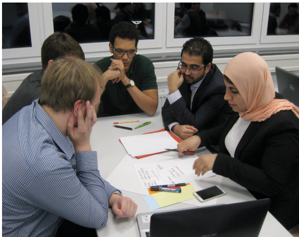
Teilnehmer während der Gruppenarbeit

Der Zuspruch war bemerkenswert. Mehr als 20 Studierende fanden sich an einem Freitagabend freiwillig für einen Workshop zusammen, über ihre regulären Studienverpflichtungen hinaus.