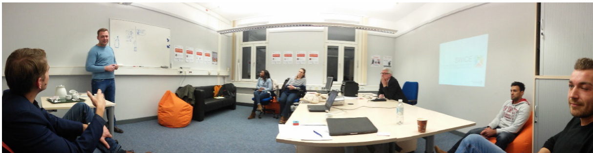
Die Teilnehmer des Barcamps bei der Diskussion einer Geschäftsidee..

tionsprojekte oder auch Sport-, Kunst- oder soziale Projekte handelte. Dementsprechend war auch die Mischung der vorgestellten Ideen. Diese stammten aus den Bereichen Pädagogik, IT und Maschinenbau. Auch zwei externe Projekte, die nicht von Studierenden aus Soest stammen, wurden vorgestellt. Die Teilnehmer gaben eine neutrale Meinung zu den vorgestellten Produkten und Geschäftsmodellen ab und halfen so den Präsentierenden, ihr Projekt weiterzuentwickeln.