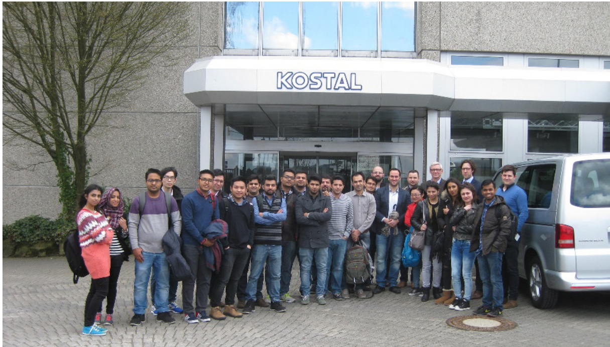
Die Studierenden vor dem Stammwerk von Kostal in Lüdenscheid.