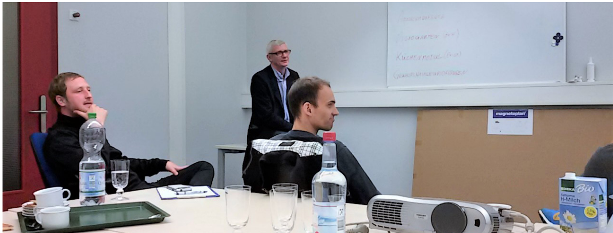
Workshop mit dem Gründerteam von Greencube Garden im SWICE Lab.

Das SWICE-Lab ist seit Anfang 2016 das Zentrum aller Aktivitäten von SWICE. Es dient als Arbeitsraum für Gründungsprojekte und bietet den Teams die Möglichkeit dort Meetings abzuhalten. Zudem finden im SWICE-Lab regelmäßig Workshops statt. Entweder gemeinsame Workshops mit mehreren Gründungsprojekten, wie beim SWICE Barcamp, oder speziell auf einzelne Gründungsprojekte zugeschnittene Workshop. SWICE hat dafür zahlreiche Instrumente entwickelt, die je nach Entwicklungsstadium des Projekts spezifische Problemstellungen angehen, sei es zum Thema Teambuilding, Geschäftsmodellentwicklung oder Finanzierung. Neben dem Stipendium „Campus Start-up Soest“ ist das SWICE-Lab eine wichtige Säule zur konkreten Unterstützung von Gründungsprojekten. Studierende, die an einem Gründungs- oder Innovationsprojekt arbeiten, können sich formlos für die Nutzung des SWICE-Labs bewerben.