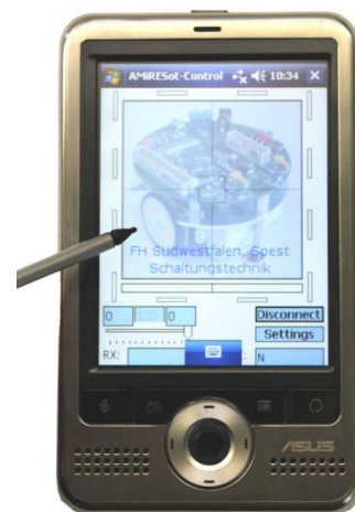
PDA-Softwareoberfläche zur Robotersteuerung

Für dieses Projekt werden Studierende der Fachhochschule Südwestfalen gesucht, die eine Abschlussarbeit (Bachelor, Master, Diplom) anfertigen wollen, als studentische Hilfskraft tätig sein möchten oder im Fachgebiet Schaltungstechnik / Industrieelektronik mitarbeiten wollen, um Erfahrung im Bereich der Schaltungsentwicklung zu sammeln.